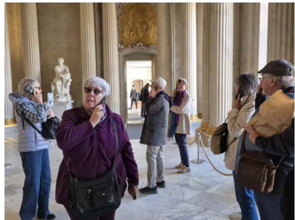
Im sehr schönen und wunderbar gelegenen Schloß Sansoucci in Potsdam gibt es keine persönlichen Führungen mehr! Aus diesem Grunde scheint es am Foto rechts, als ob alle „Amici“ „telefonieren“ würden... Der Schein kann trügen...!